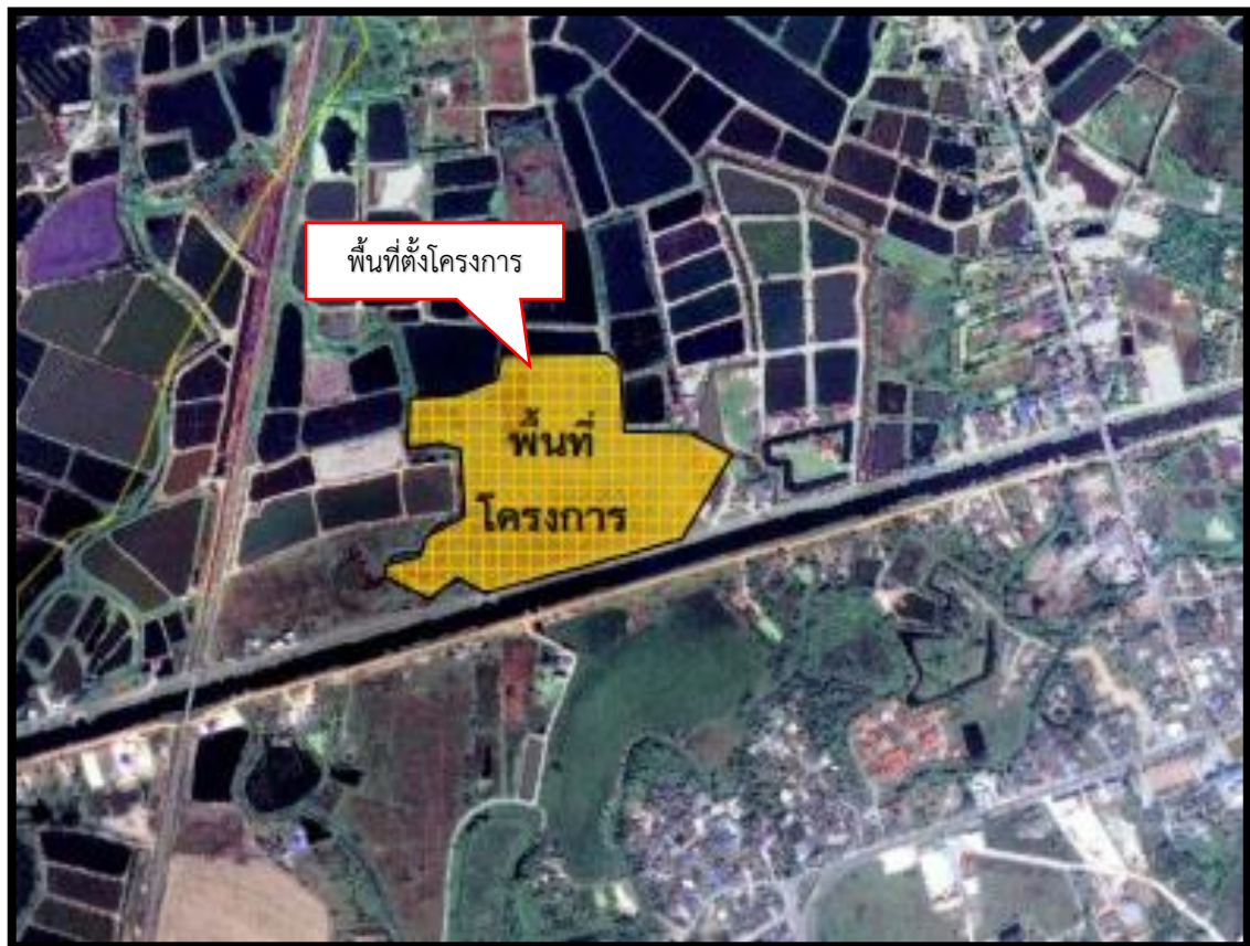
รูปที่ 1.2-1 ที่ตั้งโครงการ